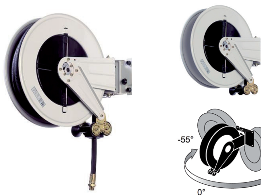
Hose reels Arrotolatori

Stainless steel industrial hose reels with ABS shock proof drum.