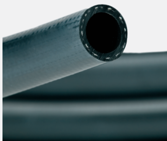
Polyurethane hoses Tubi in poliuretano

Polyurethane hoses extremely flexible and light; spark proof, ideal for light devices; color black; working pressure: 10 bar - 145 psi. Suggested for 1/2" impact wrenches. Length on demand.