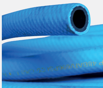
Antistatic Hose Tubo Antistatico

Rubber hose that dissipates electro-static discharge; excellent weather resistance; extreme flexibility; color blue; working pressure: 12 bar - 174 psi. Suggested for Atex impact wrenches. Length on demand.