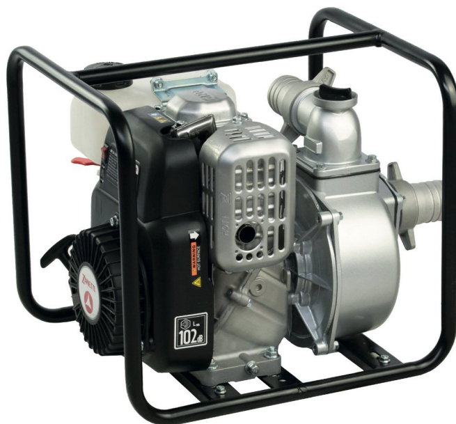
ZEN 40-130 BA